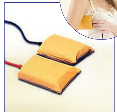
Elektrody pod pachy